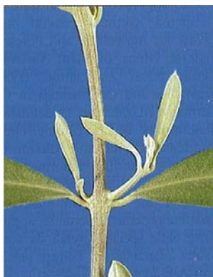
2. Accrescimento del germogli