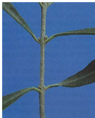
1. Stasi vegetativa