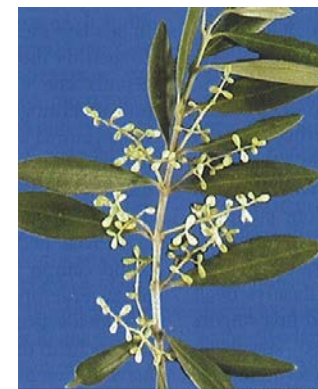
3.b. Sviluppo mignole