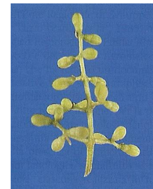
3.c. Completa mignolatura