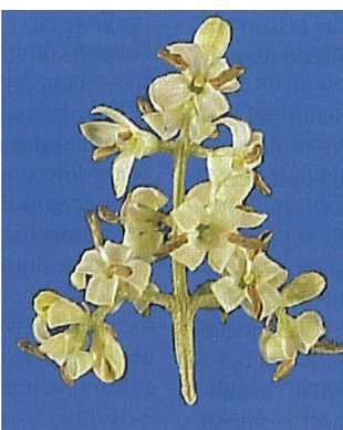
4.b. Piena fioritura