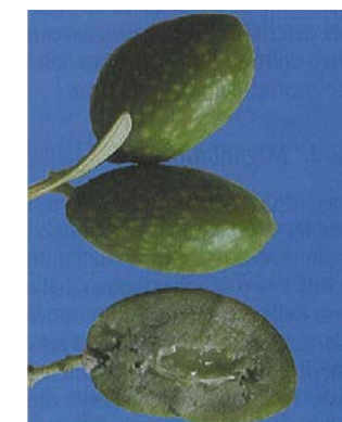
6.b. 2° fase - Indurimento nocciolo