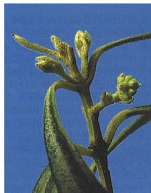
3.a. Inizio mignolatura