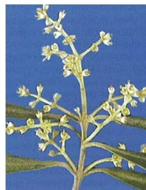
4.c. Fine fioritura