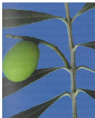
6.c. 3° fase - Accrescimento frutto