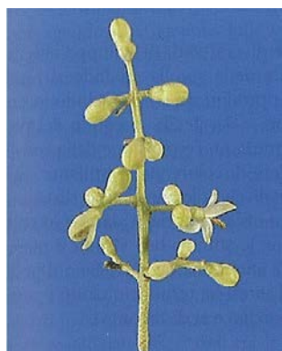
4.a. Inizio fioritura