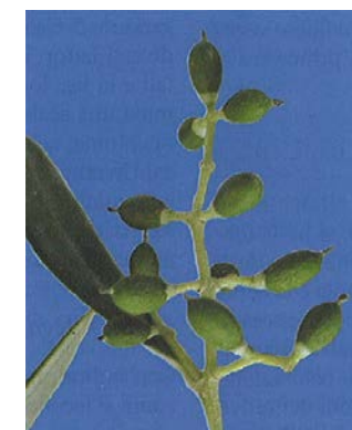
6.a. 1° fase - accrescimento frutto